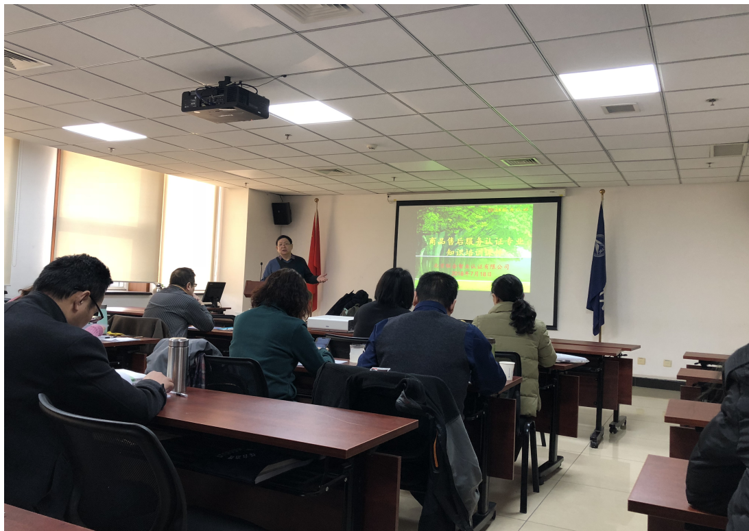
2019年2月21至25日服务审查员培训

分享，审核员队伍互帮、互学氛围正在逐渐形成。航标时代2019年通过网络及现场方式对审核员进行了多次培训，涉及服务审查员培训；如何提高审核质量防范认证风险；审核案卷存在的问题分析及讲解；化工类企业的审核要点讲解；如何策划现场审核，一个完整的审核计划包括哪些内容；如何编制审核报告，审核报告内容与其附件的关系；审核工作指南解读，现场审核时，哪些证据缺失会导致现场审核失效，研讨QMS/EMS/OHSMS现场审核取证要求及证实方式；关于GJB 9001C-2017《质量管理体系要求》标准基本知识及要求、现场审核工作程序及讲解等。