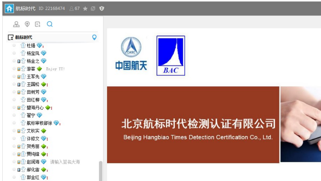
2019年6月27日通过网络对全体审核员及相关管理人员进行提高审核 质量防范认证风险的培训