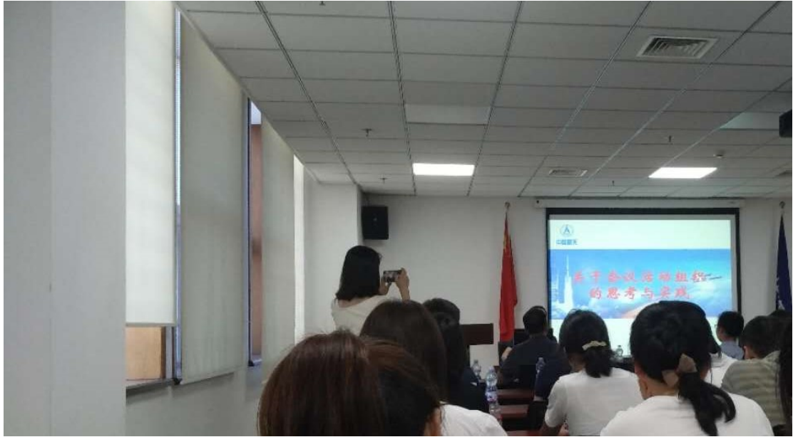
关于会议活动组织的思考与实践的培训