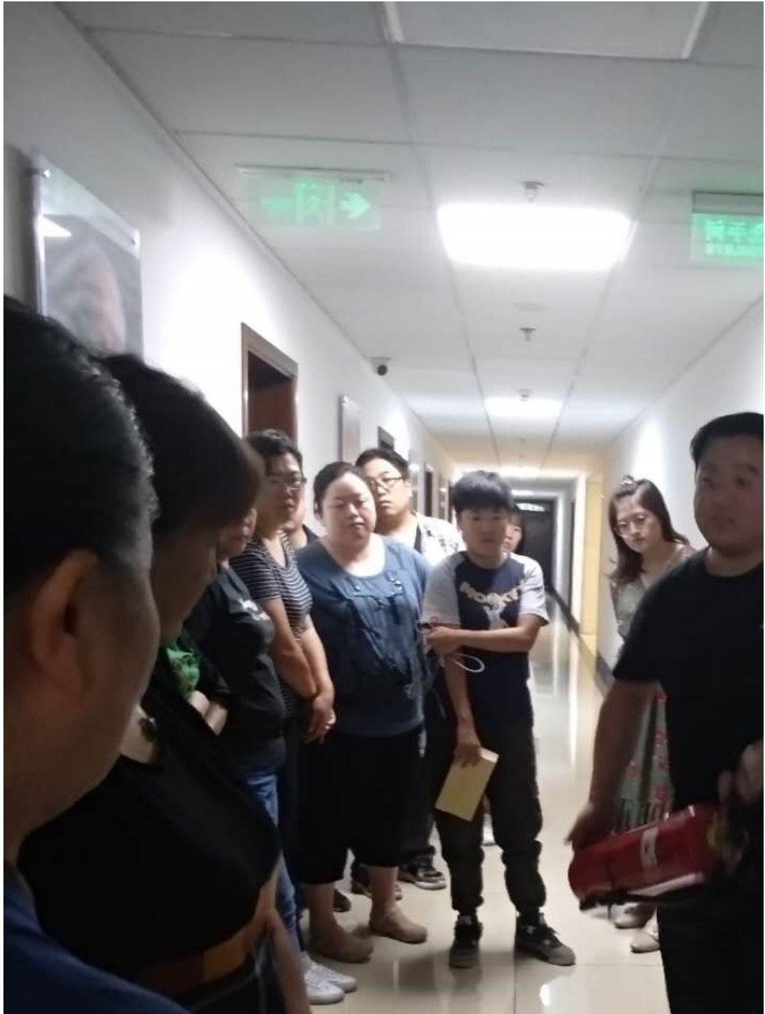
讲解灭火器的使用方法

(2) 加强应急管理，提升应急能力。航标时代不断完善安全生产相关制度，包括应急管理制度。在安全、应急管理中，包括了办公环境、审核及业务活动路途中和受审核方现场的安全应急管理。航标