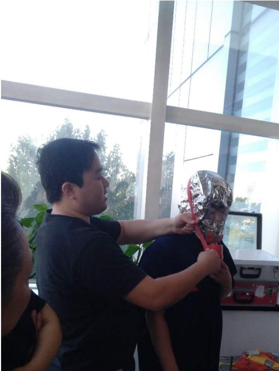
进行消防培训，正在讲解防毒面具、逃生绳等的使用