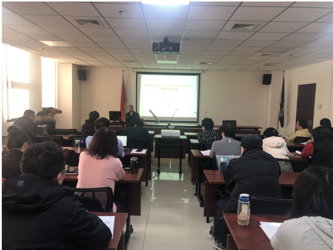
2019年12月22日举办GJB 9001C-2017《质量管理体系要求》标准及现 场审核工作程序的培训